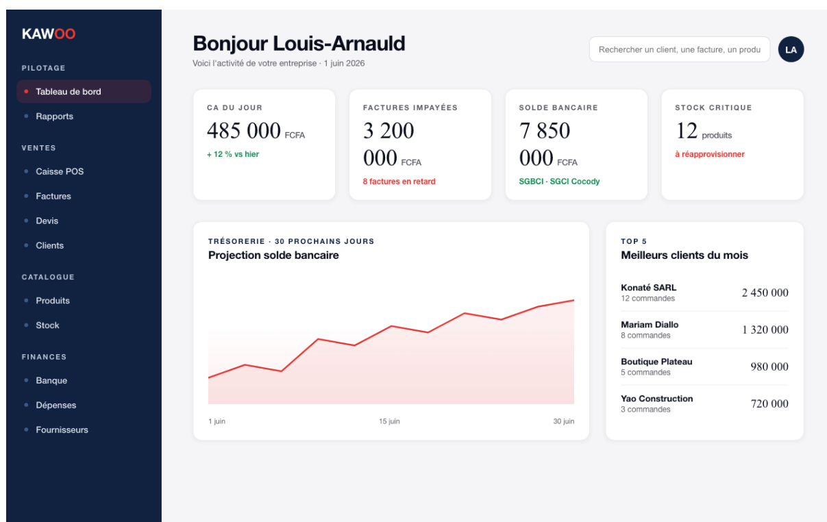
Tableau de bord après connexion · KPI, projection trésorerie et top clients

Le tableau de bord est votre page d'accueil quotidienne. En un coup d'œil, vous voyez : chiffre d'affaires du jour, factures impayées, solde bancaire consolidé, niveau de stock critique, alertes à traiter, top produits et top clients.